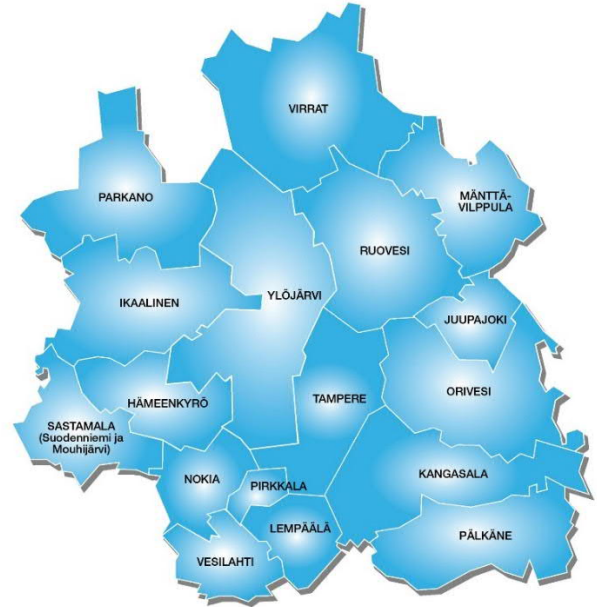
Kuva 1 Jätehuoltoviranomaisen toiminta-alue

Alueellinen jätehuoltolautakunta toimii jätelain (646/2011) 23 §:n mukaisena kuntien yhteisenä jätehuoltoviranomaisena. Jätehuollon yhteistoiminta-alueeseen kuuluu 17 Pirkanmaan kuntaa, jotka ovat Hämeenkyrön, Ikaalisten, Juupajoen, Kangasalan, Lempäälän, Mänttä-Vilppulan, Nokian, Oriveden, Parkanon, Pirkkalan, Pälkäneen, Ruoveden, Sastamalan (entisten Mouhijärven ja Suodenniemen osalta), Tampereen, Vesilahden, Virtain ja Ylöjärven kunnat. Tampereen kaupunki toimii kuntalain mukaisena jätehuollon yhteistoiminta-alueen isäntäkuntana.